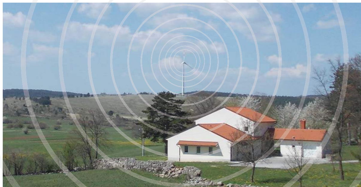
razdalja 840 m

Če preskočimo številna dejstva, ki ne govorijo v prid vetrnim turbinam, in »samo« posredno negativno vplivajo na zdravje oziroma zmanjšano kvaliteto bivanja v njihovi bližini, pa vsekakor ne moremo mimo tega, da je s številnimi študijami dokazano, da infrazvok in nizkofrekvenčni zvoki, ki jih te turbine oddajajo pri svojem delovanju, povzročajo vibroakustično bolezen oz. sindrom vetrnih turbin. Več o tem si lahko preberete na naši spletni strani ( www.senozeška-brda.si ) ali kjerkoli na internetu. Zaradi teh dognanj je v pripravi poenotena evropska zakonodaja, ki bo določala minimalno oddaljenost vetrnic od bivališč 2 km na ravninskih in 3,2 km na hribovitih področjih. Enako je tudi priporočilo slovenskega Nacionalnega inštituta za javno zdravje.